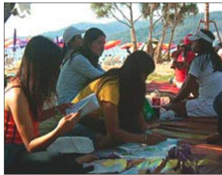
ผู้เข้าอบรมของ Empower กำลังตั้งใจเรียนที่ริมทะเล

Empower ยังมีศูนย์ข้อมูลของตนเอง โดยคุณสามารถเข้าไปค้นหาข้อมูลเกี่ยวกับพนักงานขายบริการในประเทศไทย และที่ต่าง ๆ ทั่วโลก นอกจากนี้ยังมี “เครือข่ายลุ่มน้ำโขง” หรือประเทศที่แม่น้ำโขงไหลผ่าน เพื่อเป็นการกระชับมิตรภาพระหว่างพนักงานบริการที่ทำงานอยู่ในดินแดนเหล่านี้ โดยตระหนักถึงความจริงที่ว่า การรวมกลุ่มที่เข้มแข็งของพนักงานบริการ จะช่วยพัฒนาสภาพด้านสุขภาพและความเป็นอยู่ที่ดี