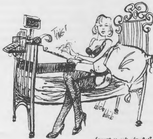
Spaart u ook airmales?